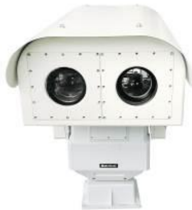
森林防火自动预警探测一体机